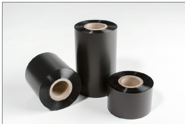
Folie for utskrift på krympeslange og TIPTAGs.

ID: Indre standarddia. på rullkjerne er 25,4 mm.